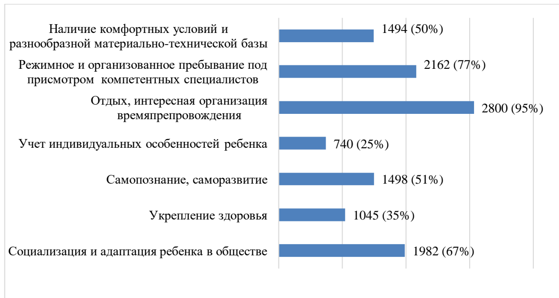
Рисунок 2 – Ожидаемые результаты родителей (законных представителей) после посещения организаций отдыха и оздоровления в 2024 году

На Рисунке 2 представлены варианты ответов респондентов.